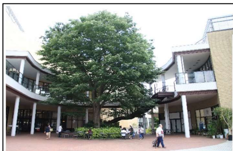
イオンモール多摩平の森(写真)では公団住宅にあった在来樹約50本を残していて、ケヤキを取り囲んだ建物入り口は来店者の憩いの場になっています。

樹木医の契約は 10月末まで、市の担当者は、今後、結果をホームページなどで公表したいとしています。