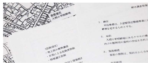
開示された樹木医委託に関する公文書

イオンは通常、地域の木を可能な限り残し無理でも移植するとしています。イオンモール東久留米ではグラウンドにあった名木のアカマツを「地域のために」(モール担当者)ほぼ自己負担で管理しています。