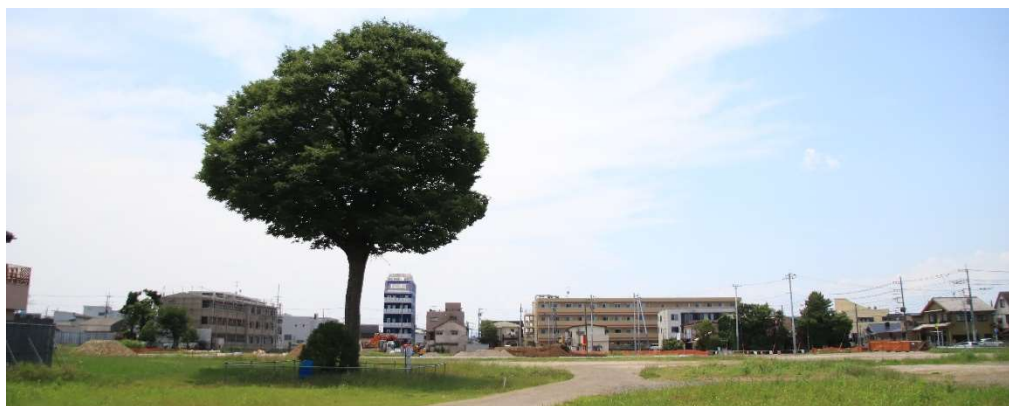
イオンの建設用地に残されている入間小のケヤキ

複数の樹木医や造園業者は少なくとも敷地外から見た限り枯れる恐れや倒木などの問題は見当たらないとしており、仮に樹勢が衰退していても有効な回復処置があるとしています。