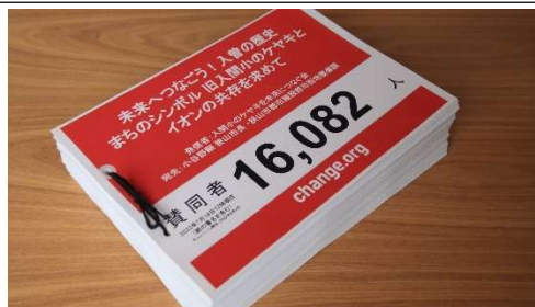
寄せられた署名 (第 1 次提出分)

私たちは 8 月 1 日、イオンリテールとの話し合いを実施しました。同社の担当者は、公募でなければ通常は象徴的な