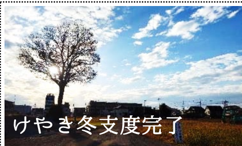
けやき冬支度完了

一般質問に対する市長や都市建設部長の答弁によると、11月2日の市とイオン(株)との包括連携協定締結のとき、同席したイオンリテール(株)からケヤキ共存の意向が市に示されました。市長は、現段階でその方針がまだ決まっているわけではないとしながらも、ブックカフェやキッズパークの機能、落枝など安全面の対策が事業者の責任で確保されることなどを条件に新たな提案を受けたとしています。