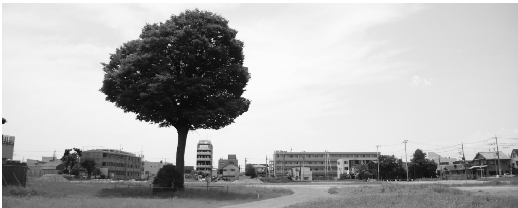
イオンの建設用地に残されている入間小のケヤキ

複数の樹木医や造園業者は少なくとも敷地外から見た限り枯れる恐れや倒木などの問題は見当たらないとしており、仮に樹勢が衰退していても有効な回復処置があるとしています。