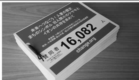
寄せられた署名(第1次提出分)

私たちは8月1日、イオンリテールとの話し合いを実施しました。同社の担当者は、公募でなければ 通常は象徴的な